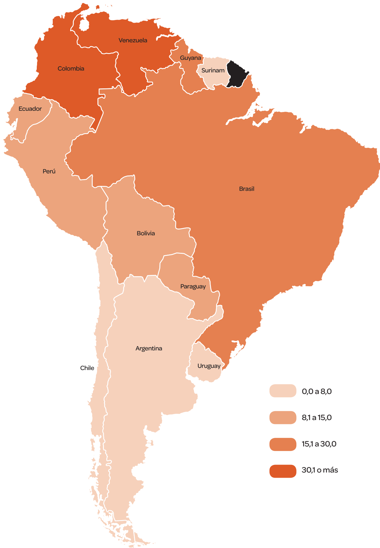
Mapa 1. Tasa de homicidios por 100.000 habitantes – América do Sul